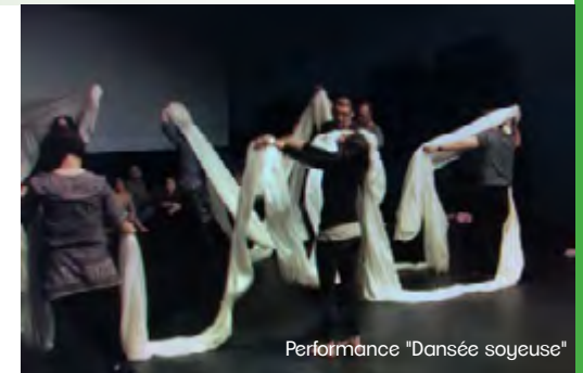
Performance "Dansée soyeuse"